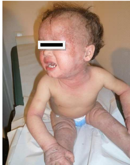
Fig.4 La DA qui va mal est une DA souvent négligée

Ce paragraphe est essentiel à intégrer, toute phobie entraîne un évitement, donc dans la DA une aggravation des lésions. Seule l'éducation thérapeutique fait diminuer craintes et réticences. Dans notre expérience la DA de l'enfant qui répond mal à la thérapeutique est avant tout une DA mal soignée (Fig.4)