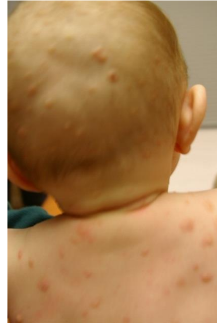
Signe de Darier